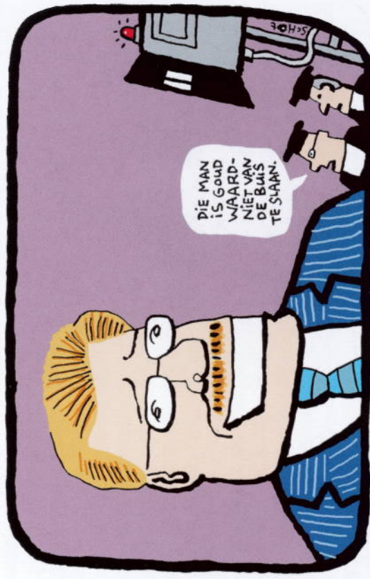
EIJFFINGER WIL MINDER BESCHIEDEN UNIVERSITEIT