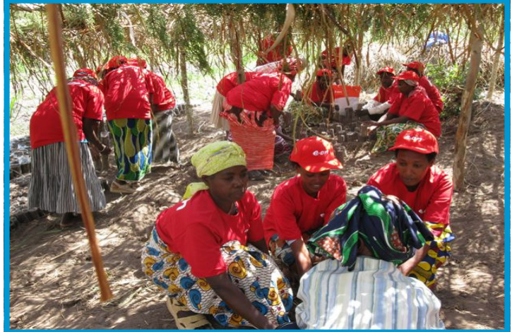
Op deze foto ziet u vrouwen aan het werk in de fruitgaard in Nyanza (zuid-Rwanda). Deze fruitgaard is mogelijk gemaakt door E.ON.